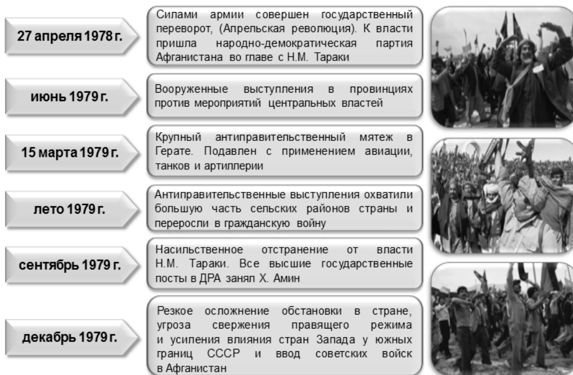
Рисунок 1. Динамика развития военно-политического кризиса в Афганистане в конце 1970-х годов