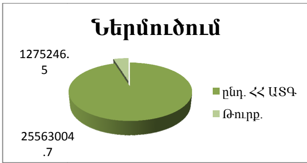
Գծապատկեր 1. Թուրքիայի բաժինը ՀՀ ներմուծման մեջ 2014-2019 թթ.: Հաշվարկվել է աղյուսակի տվյալների հիման վրա:

Աղյուսակ 2-ին և գծապատկերին նայելով կարող ենք ասել բավականին անկայուն ներմուծման և կայուն աճող արտահանման մեջ զգալի մասնաբաժին ունի նաև Թուրքիան: Մասնավորապես 2014-2019 թթ. ՀՀ ներմուծման 4.99 %-ը բաժին է հասել թուրքական ծագում ունեցող ապրանքներին, իսկ 2017 թ. ԱՏԳ ներմուծման ոլորտի գործընկեր պետությունների շարքում 3-րդն է եղել: