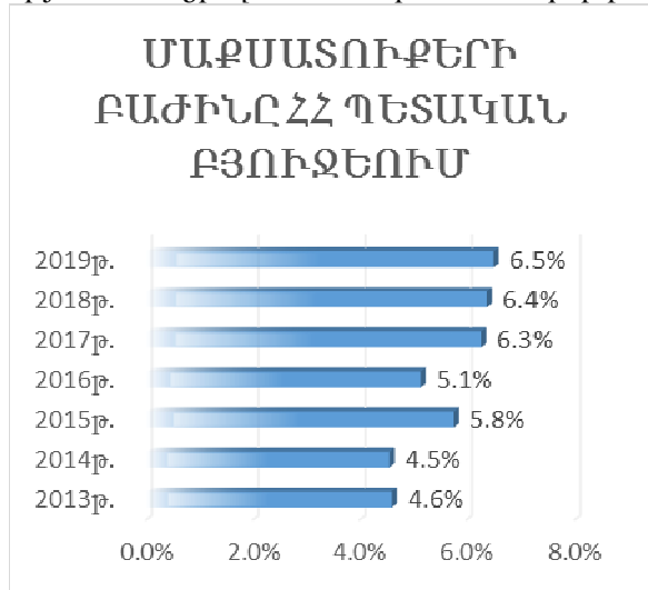
Գծապատկեր 1. Մաքսատուրքերի մասնաբաժինը ՀՀ բյուջեում

Մաքսային միությունից ամենամյա փոխանցվող տուրքերը մեծացնում են ՀՀ մաքսատուրքերի բացարձակ արժեքը, ինչի շնորհիվ էլ ավելանում է վերջիններիս մասնաբաժինը ՀՀ պետական բյուջեում: