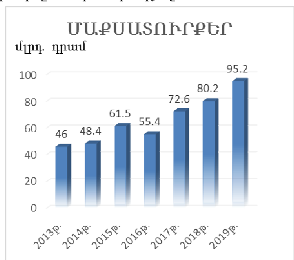
Գծապատկեր 2. Մաքսատուրքերի բացարձակ արժեքները ՀՀ բյուջեում

Ինչպես երևում է գծապատկերում (գծ.2) [3], ԵԱՏՄ անդամակցությունից հետո տարեց տարի աճում է մաքսատուրքերի բացարձակ արժեքը, բացառությամբ 2016թ.: Պատճառներից մեկը, այդ ընթացքում երրորդ երկրներից ներկրվող մաքսատուրքով հարկվող ապրանքների ծավալի կրճատումն էր, ինչպես նաև միու-