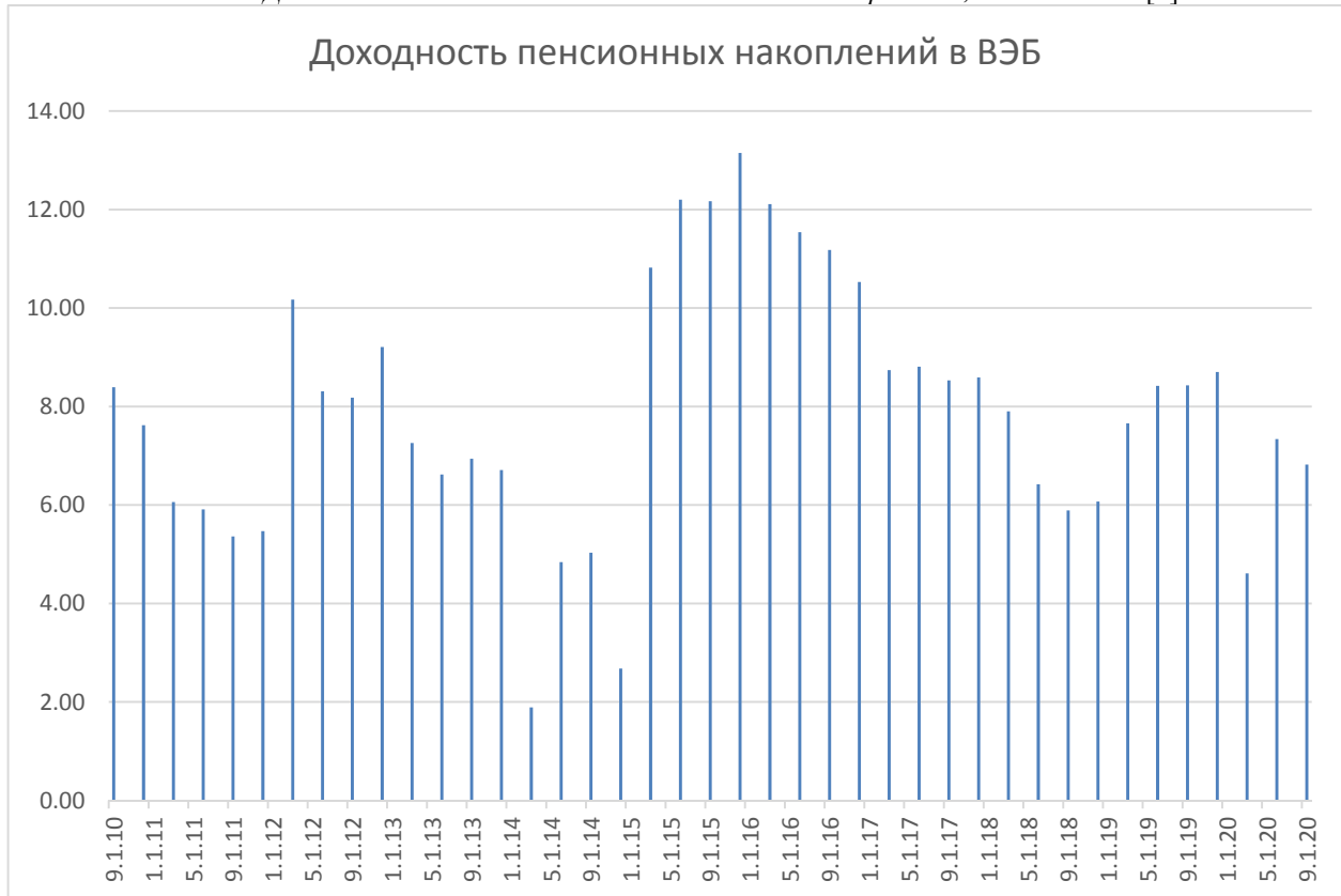
Рис. 2. Доходность пенсионных накоплений в ВЭБ по кварталам, 2010-2020 гг. [4]

взносов государства не может превышать 12 000 рублей в год). Программа будет действовать до 2025 года.