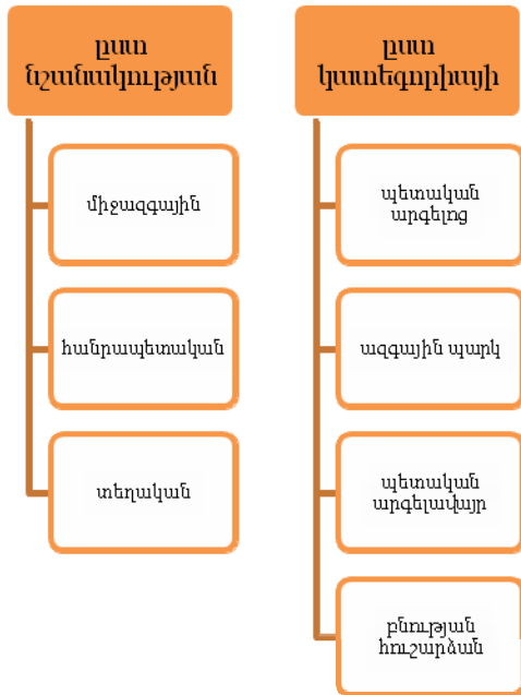
Գծապատկեր 1. ԲՀՊՏ-ների դասակարգումը ՀՀ-ում [9]

ՀՀ-ում կան 3 պետական արգելոցներ, 4 ազգային պարկեր, 27 պետական արգելափայտեր: