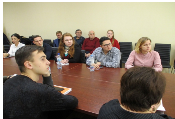
Участники студенты и нижегородская армянская община.