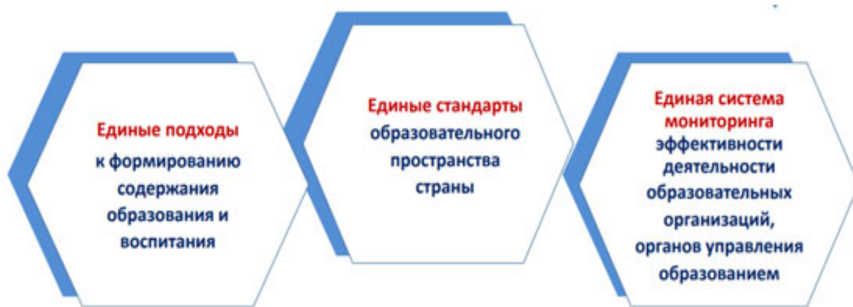
Рис. 2. Основные компоненты единого информационного образовательного пространства [1, с. 10].

Некоторые специалисты вкладывают в единое информационное образовательное пространство не только образовательную деятельность. Они предлагают расширенное толкование, указывая на то, что это не только качественное образование, но и воспитание и профессиональная ориентация. По нашему мнению, такое понимание имеет место. При этом образовательную и воспитательную компоненту целесообразно дополнить едиными стандартами и единой системой мониторинга (рисунок 2).