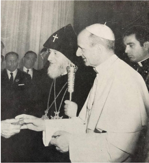
Վազգեն Ա վեհափառը և Պողոս Չ Պապը Հռոմում 1970 թ. մայիս

րով: Այդ ճառերը ամբողջովին հրապարակված է: Սակայն բերենք այդ ճառերից համառոտ մեջբերումներ՝ պատկերացնելու համար հանդիպման հիմնական նպատակը: