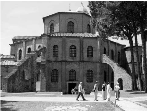
Фото 1. Храм Св. Витали, Равенна.

В столице экзархата Равенне в храме-мартирии Св. Витали (см. фото 1) до наших дней сохранились несколько великолепных византийских мозаик. Две из них находятся на боковых стенах нижнего уровня апсиды и изображают императора Юстиниана I и императрицу Феодору со своими свитами. На левой мозаике посвященной Юстиниану, предположительно, мы имеем прижизненный портрет Нарсеса, который стоит справа от императора, за его левым плечом. (См. фото 2).