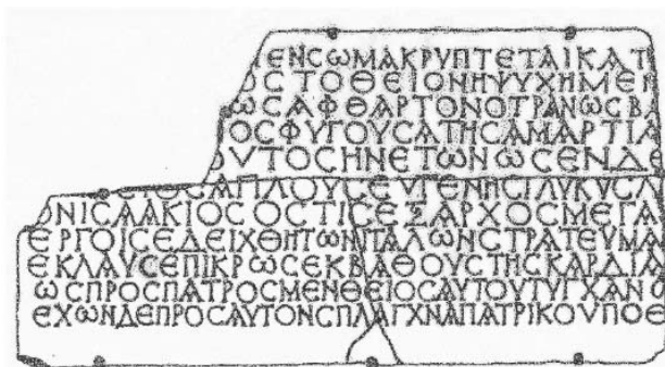
Графическое изображение эпитафии Григория [25, Fig. 30, стр. 235]

В отличии от первого события, дата второго события нам известна, это 640 год. Император Ираклий I находился в весьма затруднительном положении, безрассудное правление предыдущего императора и непрестанные войны, особенно последняя с арабами, опустошили казну. Обращение за денежной помощью к папе Григорию получило отказ, но подвернулся удобный случай. Отказавший в помощи папа скончался, а новоизбранный папа Северин еще не был признан. Именно в этот момент и произошло событие вкратце описанное в Книге Понтификов. « Et post dies aliquantas ingressus est Isacius patricius in episcopio Lateranense et fuit ibi per dies Vili usque dum omnem substantiam illam depraedarent. Eodem tempore direxit exinde ex ipsa substantia in civitate regia ad Heraclium imperatorem ». [26, стр. 176].