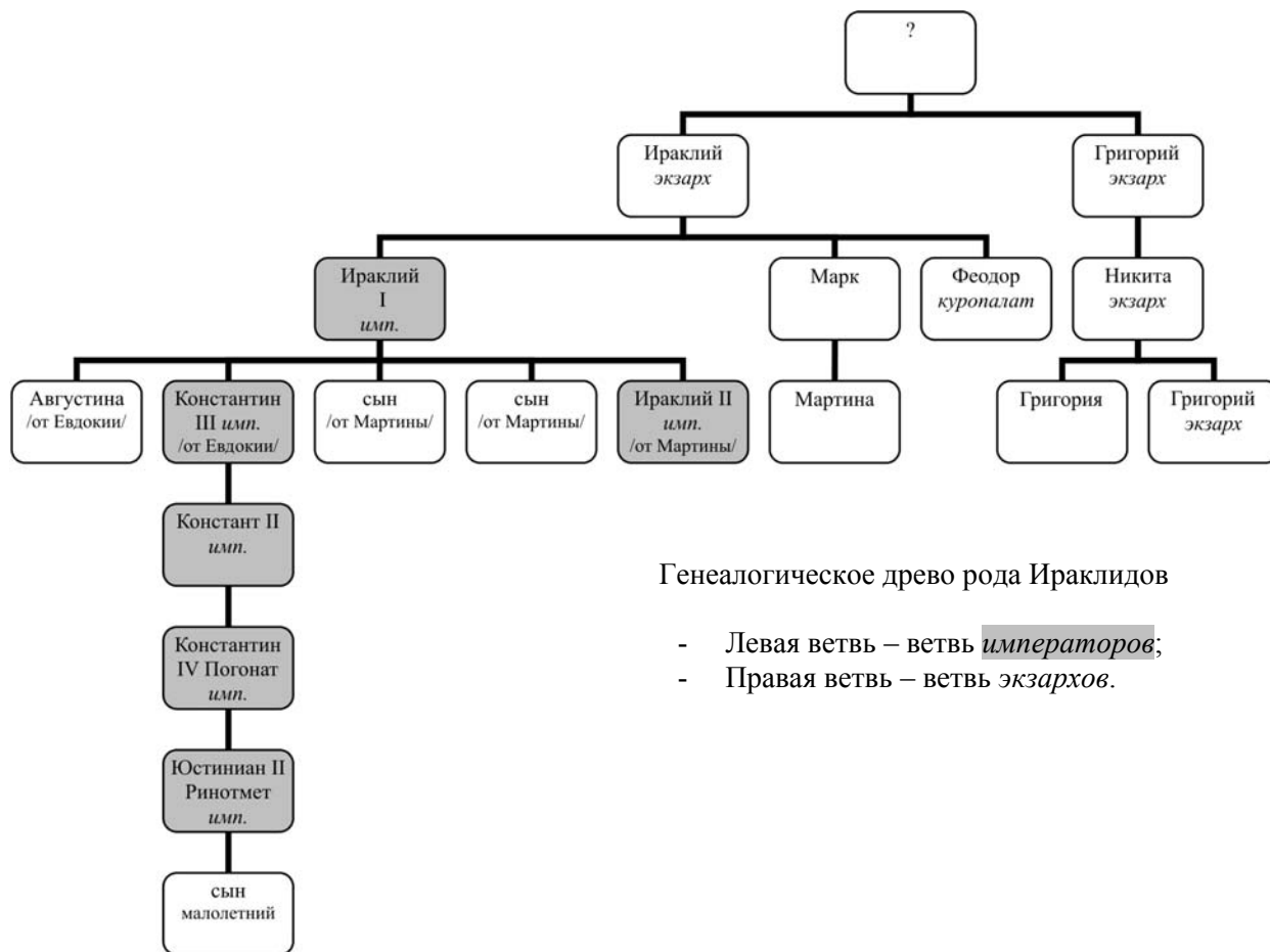
Генеалогическое древо рода Ираклидов

5. ИЗ АНОНИМНОЙ СИРИЙСКОЙ ХРОНИКИ 1234 г. Русский перевод Н. В. Пигулевской сирийского текста, изданного в Corpus scriptorum christianorum orientaliu. Scriptores syri. Series tertia, t.14. Texius syriaeus. Chronicon ad an Chr. 1234 pertinens, ed. J. B. Chabot