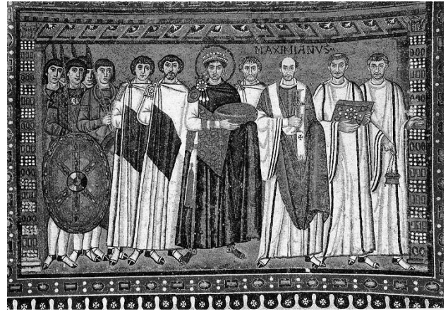
Фото 2. Мозаика Юстиниана в храме Св. Витали, Равенна.

открытым небом. [25, стр. 65]. В 1877 г. саркофаг был перенесен в национальный музей, а в 1904 г. возвращен в часовню [29, стр. 177]. В настоящее время саркофаг с урной от пепла находится в южном проходе храма. Он установлен на четырех опорных элементах, не принадлежащих первоначальной структуре. [25, стр. 66].