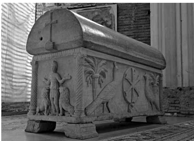
Фото 3. Саркофаг Исаака Айказна в храме Св. Витали, Равенна.

Впервые она была опубликована монахом-бернардинцем в 1702 г. в Париже [27]. Некий Камилио Спрети, перенес ее к себе домой из церкви Св. Мауро в Камаккьо [30]. В дальнейшем она оказалась в Палатах равеннского архиепископа Фарсетти, а ныне хранится в архиепископском музее Равенны (ит. Museo Arcivescovile di Ravenna). [25, стр. 90].